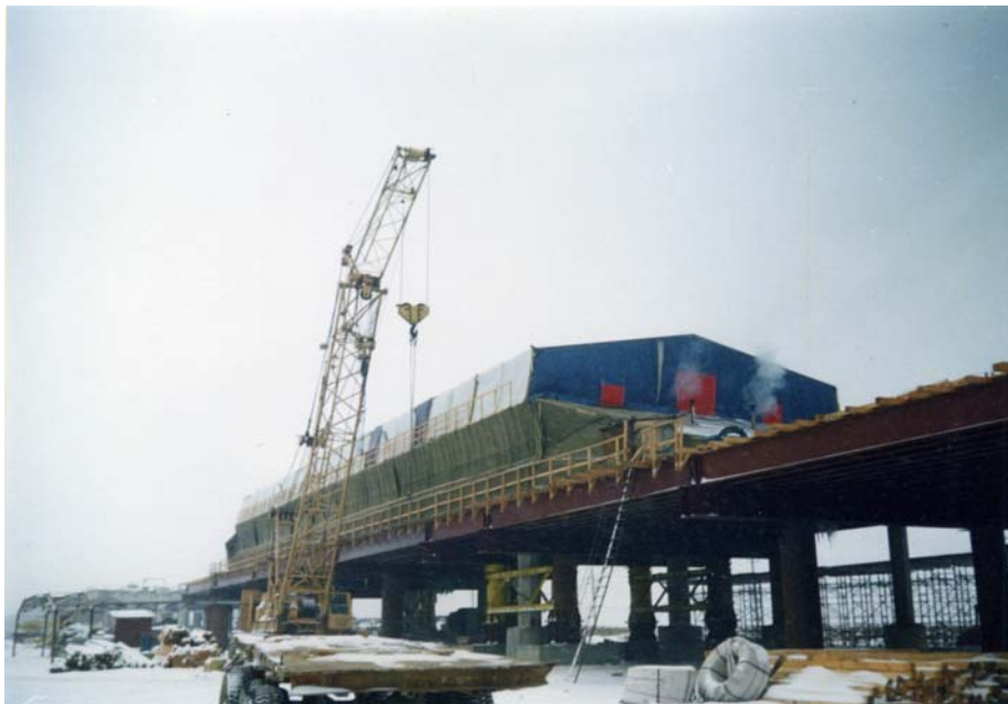
Каркасно-тентовый тепляк в Москве.