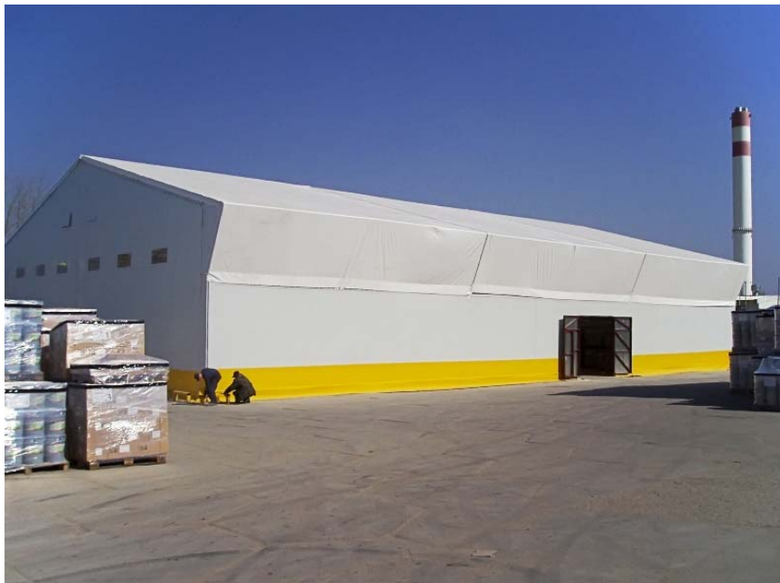
Тентовый склад для лакокрасочной продукции в г. Купавна, М.О.