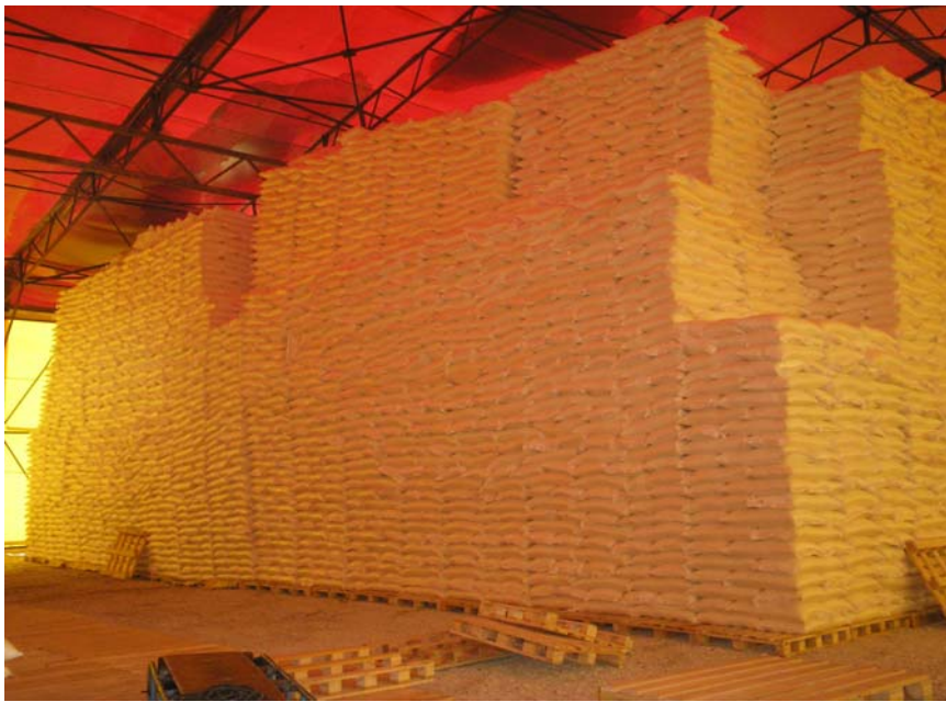
Тентовый ангар для временного хранения сахара в Пензенской области, вид изнутри.