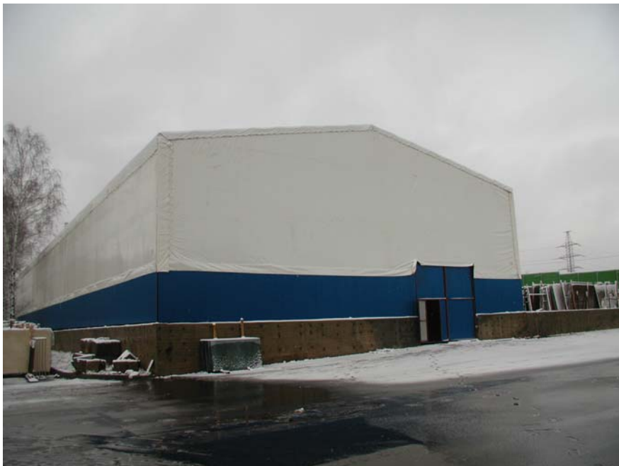
Комбинированный склад из профлиста и тентовой ткани ПВХ для хранения плитки и мрамора в г. Мытищи.