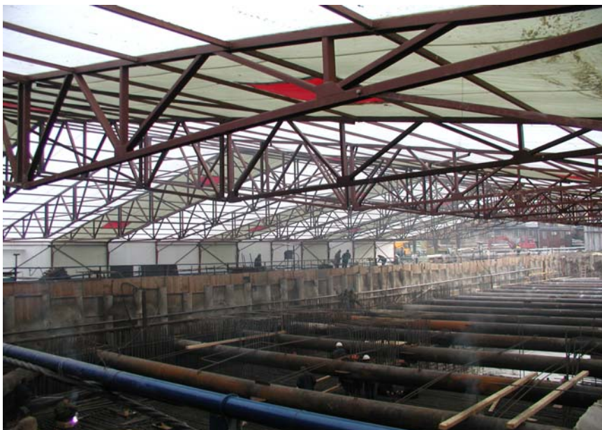
Тентовый тепляк на Лефортовском мосту.