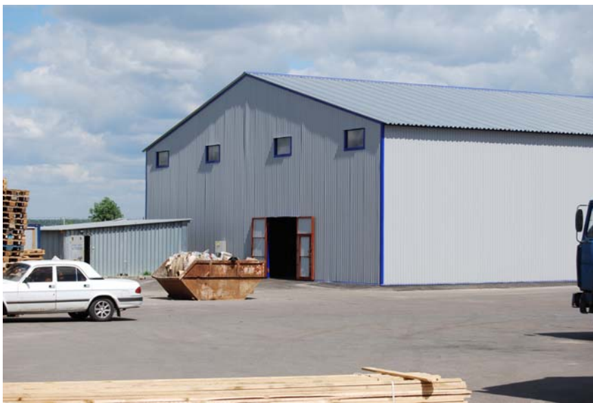
Склад лакокрасочной продукции в г. Люберцы.