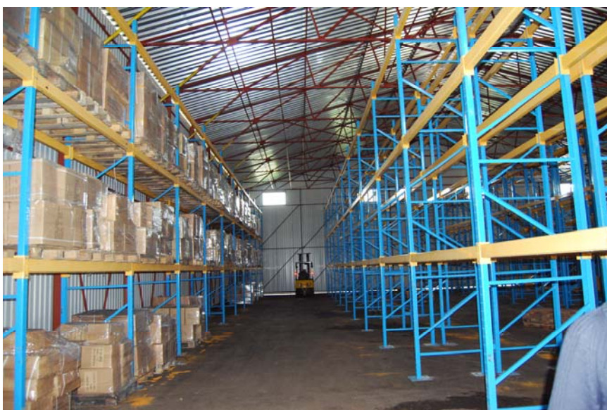
Склад лакокрасочной продукции в г. Люберцы, вид изнутри.