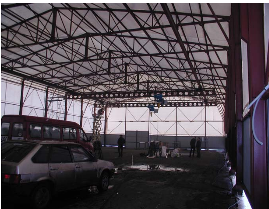
Вид изнутри комбинированный склад из профлиста и тентовой ткани ПВХ для хранения плитки и мрамора в г. Мытищи с 2-мя кран балками грузоподъемностью по 7 тонн.