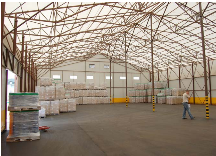
Тентовый склад для лакокрасочной продукции в г. Купавна, М.О вид изнутри.