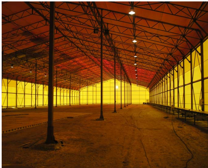
Тентовый ангар для временного хранения сахара в Пензенской области.