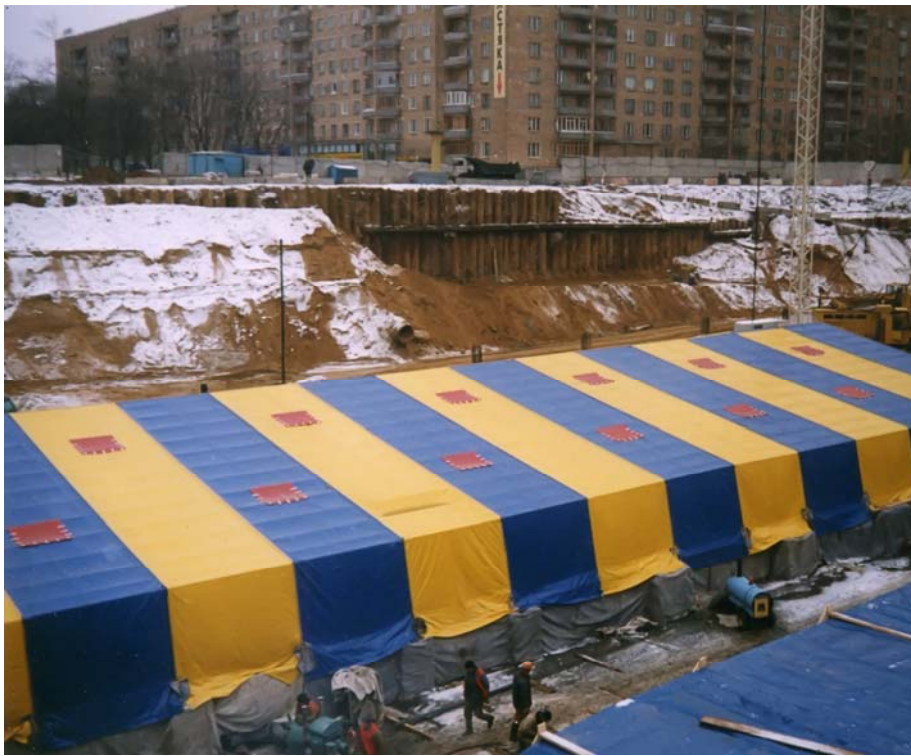
Каркасно-тентовый тепляк в Москве.