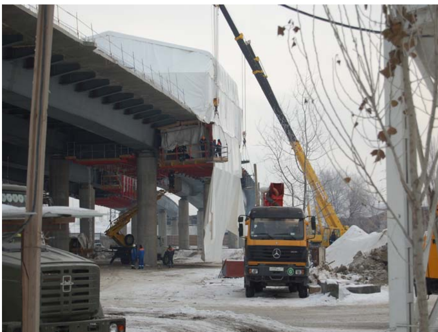
Агрегат непрерывного бетонирования в Ростовской области.